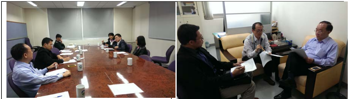
圖 8.1-1 訪談照片

未來將繼續針對環保署重要組織管理階層人員(預計 2-3 位)進行訪談(訪談內容請參表 8.1-1)。